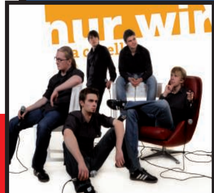
NUR WIR - DIE A CAPELLA-GRUPPE AUS KIEL

DIE NEUE SPIELZEIT BIETET WIEDER EINE GROSSE AUSWAHL AN KABARETT, COMEDY, LESUNG, KINDERTHEATER UND MUSIKALISCHEN VERANSTALTUNGEN.